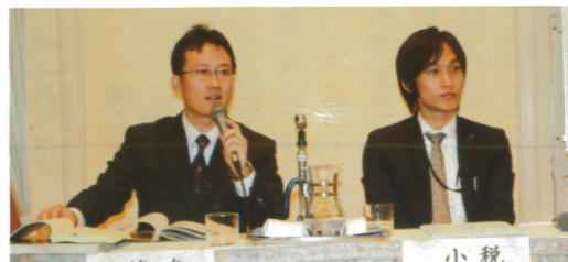
小笹氏(右)と渡邊氏