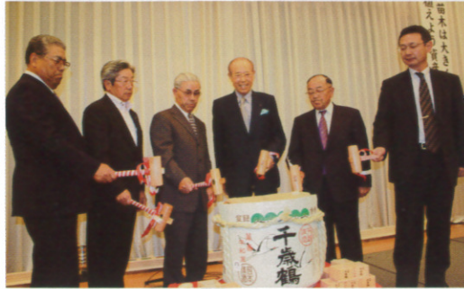
塩田会長とオーナー様代表が元気に鏡開き