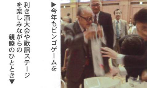
▶今年もビンゴゲームを 利き酒大会や歌謡ステージ を楽しみながらの 親睦のひととき▼