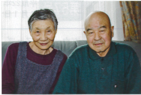
手倉森さんご夫妻

合わなくなった「第3マンション幸福」がこのほど、木造ALC、1LDK4世帯入居の最新アパートに生まれ変わりました。室内はエアコン完備、ブロードバンド・インターネット