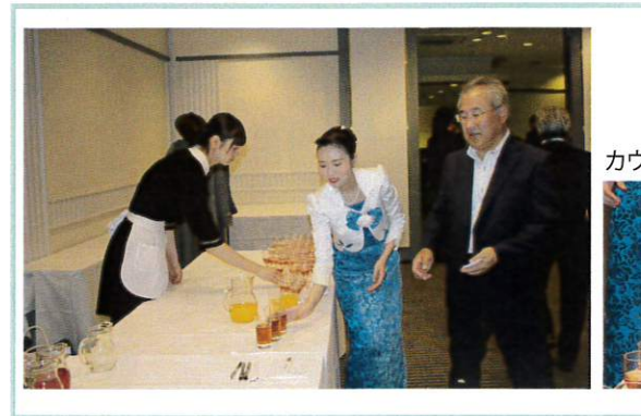
カウンターに並んだドリンク

ウェルカムドリンクで心ばかりのおもてなし 小講演の前に心ばかりのおもてなしを——今年も、会場内の一角に、ウェルカムドリンクをサービスするコーナーを設けました。 用意したのはウーロン茶やオレンジジュースなどのソフトドリンクのほか、シャンパンカクテルなどアルコール。開始前のちよつとした待ち時間で、皆様にくつろいでいただきました。