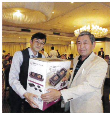
ホットプレートを当てたお客様