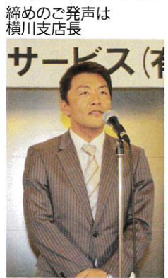
締めのご発声は横川支店長