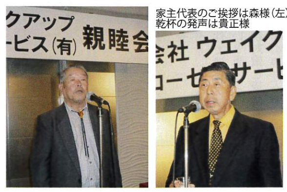
家主代表のご挨拶は森様(左)乾杯の発声は貴正様