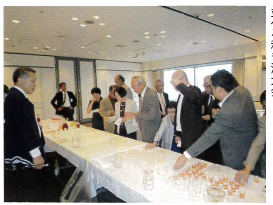
4種類のアルコールを価格の高い順に並べる利き酒大会

会場内に歓談の和が広がるなか、お楽しみ抽選会と、利き酒大会の正解者発表が行われました。 毎年恒例の抽選会。テレビなど豪華な賞品が当たるので、楽しみにしている方が多い企画です。今年は賞品にあらかじめ番号が振られ、参加者全員のお名前を書いた紙の入った箱のなかからくじ引きの要領で引かれた順に賞品があたるという趣向。 1番のホットプレートから始まり、最後の東芝レグザ32型液晶テレビまで、商品券やファイターズチケット、ミキサーやリビングリモコン扇風機などバラエティに富んだ賞品が用意されました。