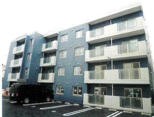
完成間近のフイノWfour (昨年12月上旬撮影)

当社が企画したフイノシリーズや、設計・施工させていただく建物は、近隣のほぼ同じ質料の建物よりも設備のグレードが高く、間取りがゆつたりと設計されて開放感があるのが、入居希望者の支持を得ている理由の一つであると思います。「フイノWfour」には、高齢社会の進展を見据えてエレベーターを設置しましたが、今後は、こうした高齢者が入居しやすい建物を供給していく必要性も感じているところです。