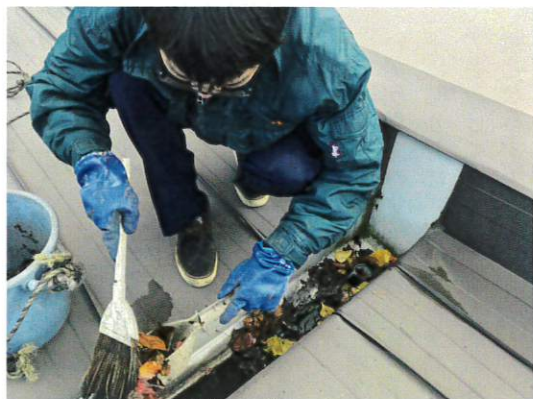
ダクトにたまっていた落葉などを取り除く

これを放置すると水が溜まり、居室の天井からの雨漏れの原因にもなりますので、冬季の積雪期前にダクト清掃を行い、合わせて屋根や建物の点検を行っています。建物の隣地や周辺に大きな樹木がある場合は、落ち葉がある程度落ち終えたのを見計らってから点検・清掃を行います。今年も例年と比べて、台風などによる強風があった影響なのか、飛沫ゴミが多かったように思いました。屋根やダクトに溜まったゴミには特にポリ袋などが多く、ガラスなどが落としていったと思われるものや、風に舞って運ばれてきたゴミも見受けられました。