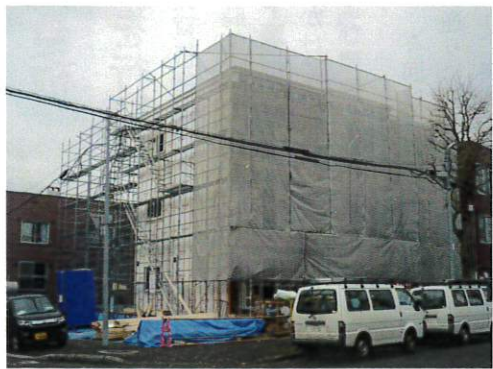
躯体が立ち上がった現場 (昨年12月撮影)

単身者向け1LDKが6世帯のアパートですが、全戸リビングルームが約10帖の広さで、約3帖のキッチンと6帖の洋室という間取りです。洋室には奥行きのあるウォークインクローゼットが設けられており、階段室のトランクルームや玄関のシューズボックスなど収納が充実しているのも、こちらのアパートの特徴です。