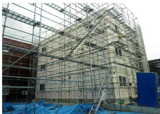
基礎工事の途中の現場 (昨年12月撮影)

昨年12月に基礎工事が始まった段階で既に3件の契約申し込みが入り、入居者募集も順調に進んでいます。