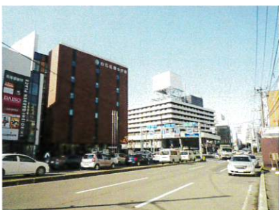
白石駅付近の南郷通り

安全な暮らしへの配慮としては、防犯カメラを設置したほか、共用玄関はオートロックに。また、単身者向けの住戸が多いので、宅配ボックスも設置しました。フイノシリーズは、当社が皆