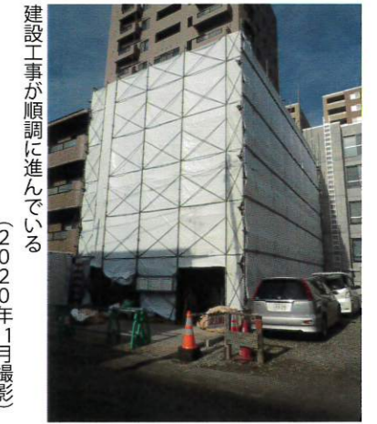
建設工事が順調に進んでいる (2020年11月撮影)