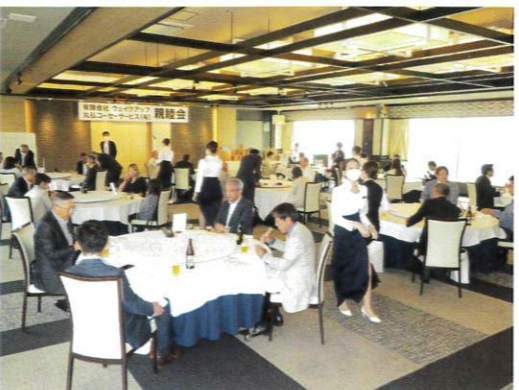
ソーシャルディスタンスをとりつつ和やかな雰囲気での親睦のひととき