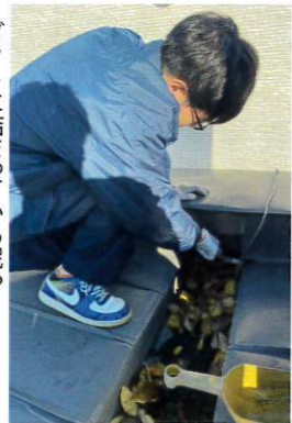
ダクトに詰まっている泥や たぐさんの落ち葉を取り除く

がある場合は、屋根にかなりの量の落ち葉が落ちているため、ある程度の量が落ち終えたところを見計らって点検や清掃を行います。今年は例年よりも気温が低く、比較的早い時期に葉が落ち切っている地域が多かったように思いました。ダクト清掃は、作業の翌日に筋肉痛となってしまうほどハードな作業です。気温の低かった今シーズンには特に、屋根の上では寒さが身にこたえましたが、ダクトに溜まったゴミや落ち葉を取り除いてきれいにした達成感や、雨漏りなどを未然に防ぐことができたという満足感を感じながら作業をさせていただきました。