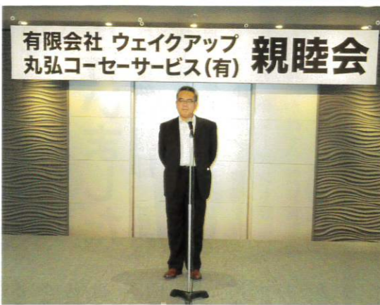
挨拶に立つ塩田社長