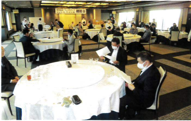
1テーブル4名でゆったり着席